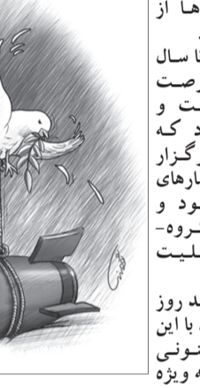
اینکه تا کی این روند ادامه داشته باشد، باید منتظر ماند و دید.

بنابراین برگزاری یک انتخابات سالم و آزاد، کار خودش را کرد تا یکبار دیگر مردم تایلند به فردی مستقل رأی دهند و به نخستین زینت و حکومت واقعی مردمی، در سر تایلند هم دست بزنند. اینک تا کی این روند ادامه داشته باشد، باید منتظر ماند و دید.